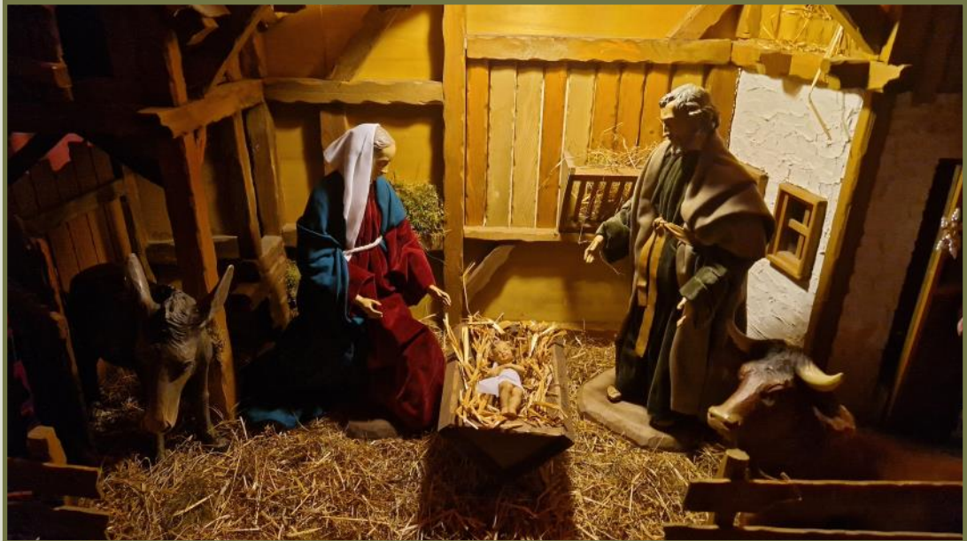
Krippe an der Stiepeler Klosterpforte

Liebe Schwestern und Brüder, wir können, wenn wir allein auf unsere schönen Krippen blicken, noch nicht ermessen, welch gewaltiger Zuspruch uns durch das Zur-Welt-Kommen des Gottessohnes erteilt. Es braucht zusätzlich noch ein extremes Zeugnis, wie das des Erzmärtyrers Stephan am Tag nach Weihnachten. Das totale Gottvertrauen, das aus Stephanus spricht, und zu dem Weihnachten uns alle animiert, erweist sich auch in den schwierigsten Situationen als tragend. Dieses Gottvertrauen ist aber nicht nur Zuspruch von Gnade. Es hat einen vernünftigen Grund und rechtfertigt darum den hohen Anspruch, der sich im Tonfall des Evangeliums