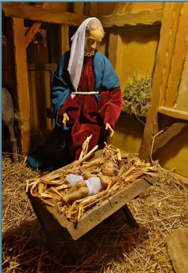
Krippe an der Stiepeler Klosterpforte

Ein Neues liegt vor uns. Etwas noch vollkommen unberührt Offenes, das sich erst noch füllt. Die ersten Stunden des neuen Jahres liegen hinter uns.