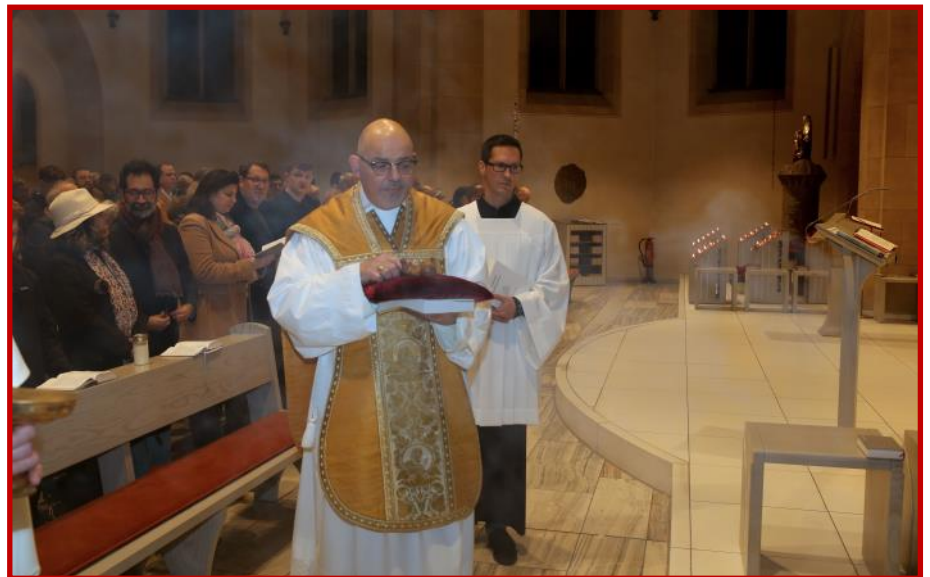
Feierliche Krippenlegung in der Christmette des Konventes