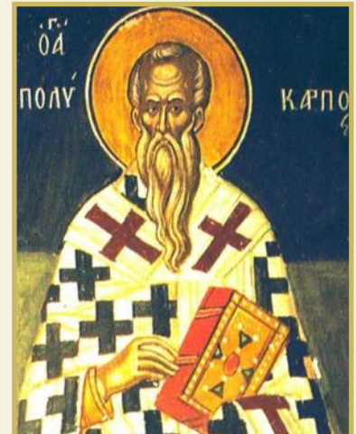
Ikone des Hl. Polykarp

So sind diese frühen Zeugen des Glaubens uns Ansporn, für unseren Glauben Zeugnis zu geben.